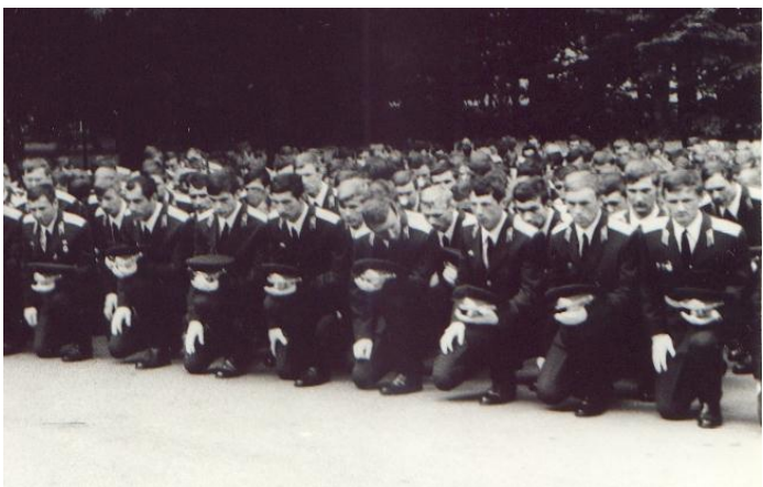
Александровский сад. У вечного огня. Клянёмся быть достойными памяти павших в боях за Родину!