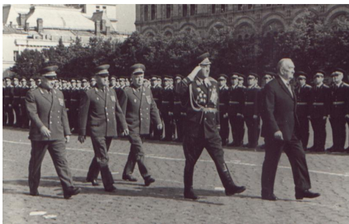
Председатель Президиума Верховного Совета РСФСР обходит строй выпускников

Выпуск нашего батальона традиционно состоялся на Красной площади. Поздравить выпускников с окончанием училища прибыл Председатель Президиума Верховного Совета РСФСР М.А. Яснов и представители высшего командного состава Вооруженных Сил СССР. На трибунах родные и близкие молодых офицеров.