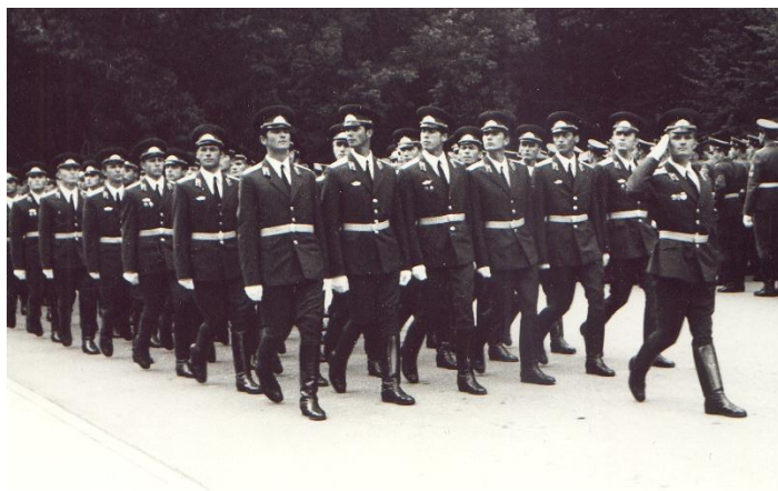
Александровский сад. Прохождение торжественным маршем у могилы неизвестного солдата.