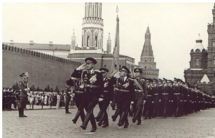
Прохождение торжественным маршем после вручения дипломов. Прощай училище! Мы лейтенанты!